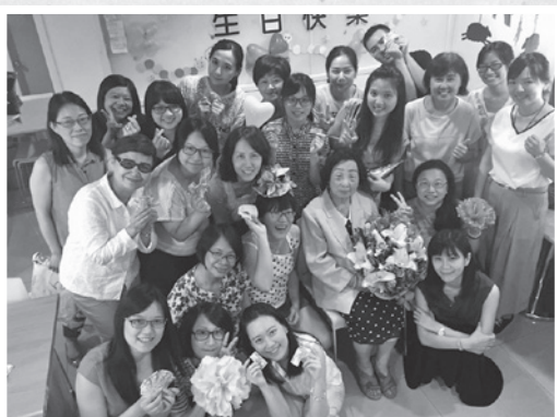
▶ 婦援會同仁為蓮花阿嬤慶生合影

婦援會同仁們準備了蛋糕、點心、水果幫阿嬤慶生，大家更輪流唱歌跳舞，使出渾身解數逗阿嬤開心，在眾人的祝福聲中，蓮花阿嬤帶著滿滿的笑容，揮手向大家道謝後，結束了這場溫馨又熱鬧的慶生會。誠心祝福蓮花阿嬤可以一直這麼健康勇健，也要再次跟她說聲，「阿嬤，生日快樂！」。