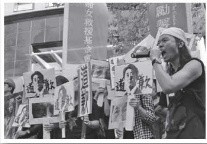
▲ 抗議現場民眾舉標語呼口號