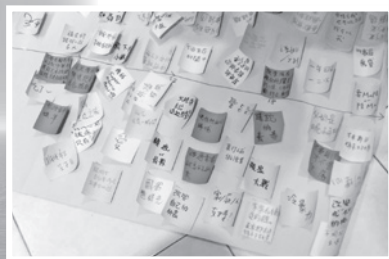
▲ 生命河流所匯集的個人故事