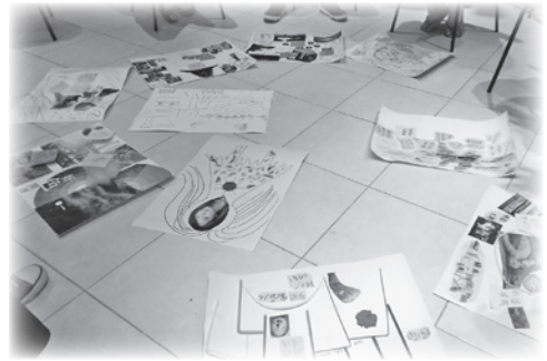
▲ 透過創作整理個人現況與期待

子關係的經驗，意外地使成員藉由擬親屬關係（尤其是父子關係）的投射，對於父執輩或子執輩的處境有了更深的理解與體悟。然而，擬親屬關係的投射也刻板化了成員自身與彼此之間的狀態，限制了成員對性別議題討論的寬廣度。