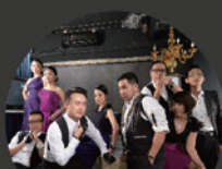
向阿嬤致敬 神秘失控人聲樂團