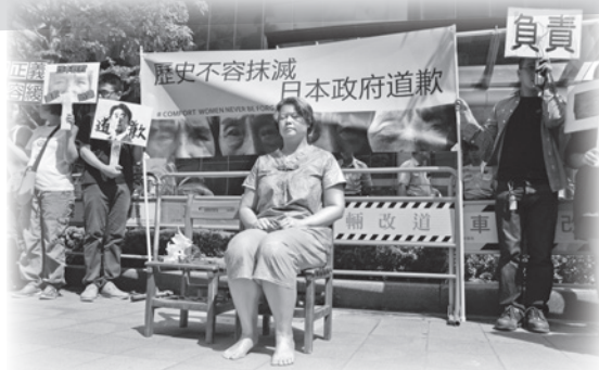
▲ 由街頭藝術表演者扮演的慰安婦阿嬤雕像

因此，婦援會在今年8月15日，懷著沉重的心情前往日本交流協會前舉行抗議活動，婦援會執行長康淑華指出，儘管日韓兩國去年12月28日就「慰安婦」議題達成協議，日本首相安倍晉三卻在今年1月18日聲稱，日韓協議並不代表日本承認「慰安婦」制度是戰爭罪行，並重申並沒有官方證據顯示「慰安婦」是被強徵的，安倍首相的言論，凸